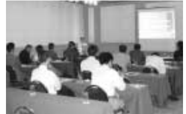
プライバシーマーク取得を目指して 会場に熱気があふれる

第1回目はコンプライアンス・プログラムをいかにして作成するか、第2回目は申請から現地審査まで、現場での実際の行動や教育の重要性などについての内容でした。プライバシーマーク取得コンサルタント業務の経験に基づいた具体的で実践的な内容であり、出席者からは具体的な質問が出て、非常に充実した内容でした。会員各社のプライバシーマーク取得に向けて大いに寄与できるセミナーとなりました。