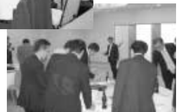
交流懇談会での乾杯