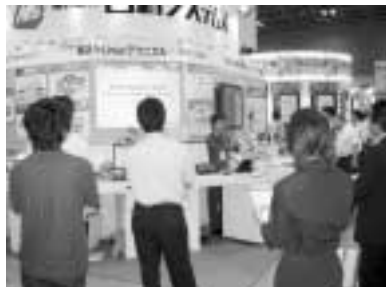
第8回ESEC組込みシステム開発技術展 6/29～7/1開催（東京ビッグサイト）

“人にやさしいソフトウェア”というスローガンを掲げ、あらゆる工業分野の監視制御に関わるソフトウェアや組込システムの開発、ライセンス事業（リアルタイムOS事業、ミ